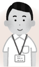
生活支援 コーディネーター

そう考えますよね。でも、生活不活発は、早く気づけば予防できます。 おもしろい研究結果が出ました。東京大学高齢者社会総合研究機構／未来ビジョン研究センターの「社会的フレイルのリスクを調べた研究」から、運動習慣はあるが他の活動をしていない人と運動習慣はないが他の活動をしている人では、後者の方がフレイルになるリスクが低く、人と「つながる、ことがフレイル(虚弱)予防にもなることがわかりました。