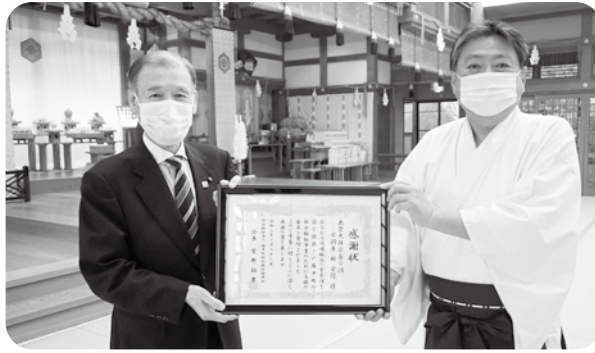
感謝状贈呈(令和3年1月22日)