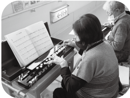
大正琴もお上手です。