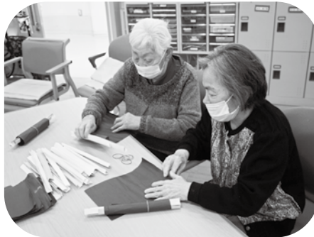
恵方巻を作りました!