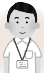
生活支援 コーディネーター

そうですね。でも、大事なことは3密を避け、感染に気をつけながら、人とのつながりや社会性を保ち、生活不活発を予防する事がフレイル(虚弱)予防にもつながるという事です。 そのためには、コロナ禍でやめていた活動を単にいつ再開という考えではなく、新しい集い方・つながり方が求められています。地域づくりでも新しい視点と創造が必要ですので、そこを一緒に考える事も「生活支援コーディネーター」の役割です。