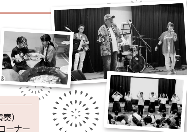
※写真は昨年の様子です

ステージ(神楽演舞、おはなし会、中高生バンド演奏) お化け屋敷、縁日コーナー、工作コーナー、飲食コーナー