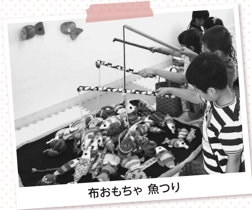
布おもちゃ 魚つり

手作りおもちゃを使って、乳幼児からお年寄りまで、誰でも安全に遊べる場・ふれあえる場を提供しています。お子さん、お孫さんと一緒に来てみませんか? 予約不要、出入りも自由です。お気軽にどうぞ!