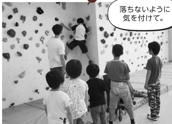
ボルダリング教室