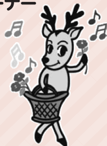
児童センターバンビーズキャラクター ディアちゃん

※この他にも夏休みの行事を 予定しておりますので詳しくは バンビーズNEWSをご覧ください。