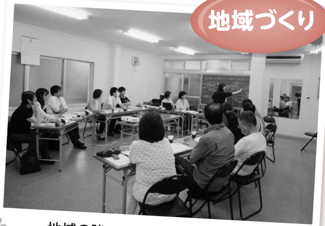
地域の強みを再発見する話し合い