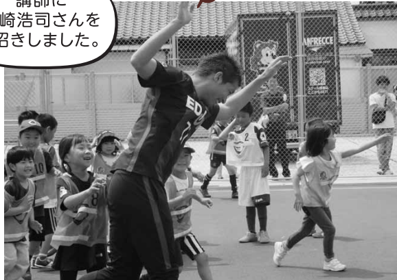
こどもサッカー教室