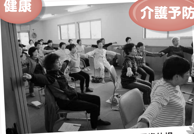
カリキュラムにあるいきいき百歳体操 (いきいきサロン・さくら会)