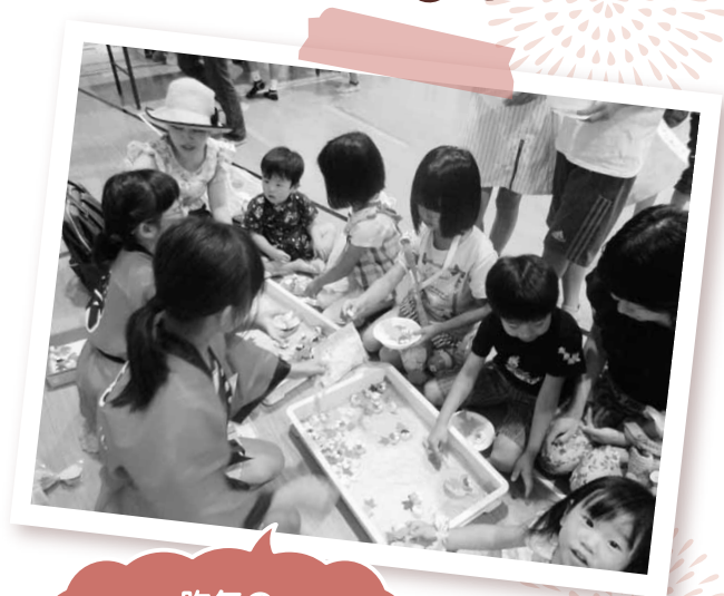
昨年の 縁日コーナーの様子