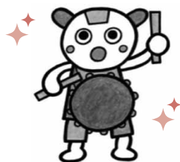
児童センターハッピーズキャラクター ボンだいこくん

児童センターは、0歳から18歳までの子どもたちを対象としています。健全育成を推進し、子どもたちの居場所やそっと寄り添える児童センターを目指しています。