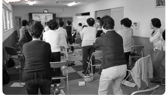
いきいきサロン 二月会の様子