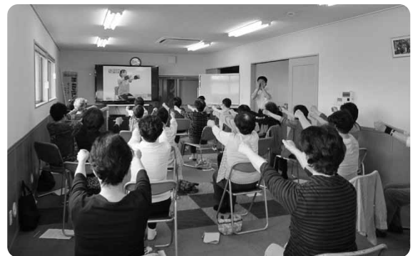
DVDを観ながら、頑張っています