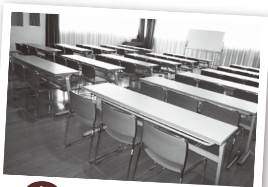
4F 研修室 (定員54名)

受付時間 午前8時30分～午後9時 (休館日:第4日曜日、12月29日～1月3日)