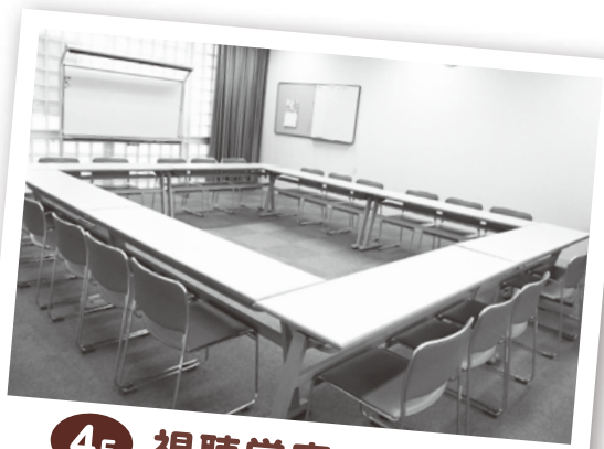
4F 視聴覚室 (定員24名)

(※)第1条 高齢者及び障害者に対する各種の福祉サービスの提供並びに住民及び住民のボランティア組織の協力による地域福祉活動の助長など総合的な住民の福祉及び健康の増進に資するため、府中町ふれあい福祉センターを設置する。