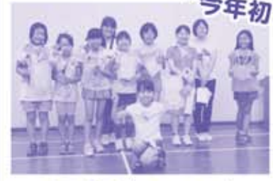
「子どもボランティア」