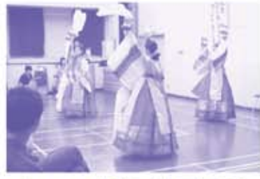
「ステージ発表 韓国舞踊」