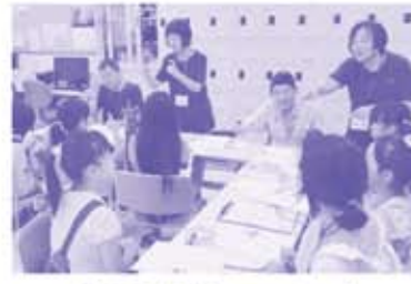
「手話体験コーナー」