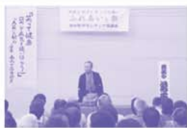
春雨や落雷師匠の「落語&医療講話」

ふれあい祭は、ボランティア活動への理解ときっかけづくりの場として、ボランティアが中心になって毎年開催しているお祭りです。【来場者数:約500名】