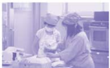
シフォンケーキ作成中!!

今年もさをり織りやスポーツ、音楽、料理を体験しました。夏休みの最後には夏祭りを開催し、多くのボランティアとふれあい、楽しい時を過ごしました。