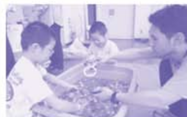
夏祭り楽しかったよ!!