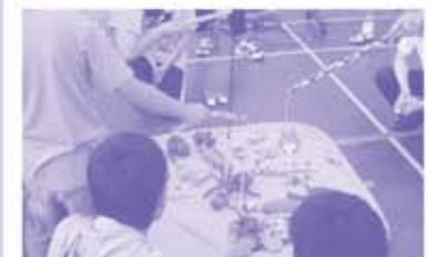
魚つりで集中力アップ!

サマースクールは多くのボランティアや協力団体の参加により実施することができました。ありがとうございました。今後も子ども達の成長を見守って頂けることを願っています。