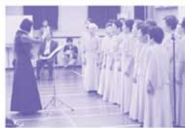
「オープニングセレモニー コーラス」