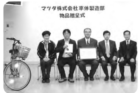
マツダ株式会社車体製造部 物品贈呈式