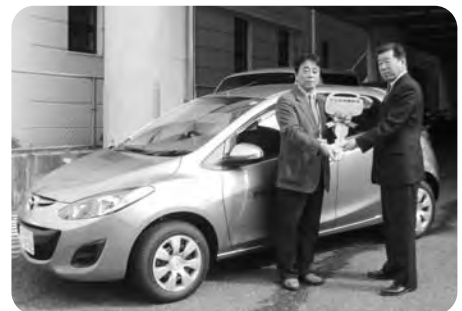
マツダ労働組合 (平成25年4月5日)