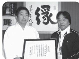
感謝状贈呈(平成25年1月15日)

東日本大震災義援金の募集期間が延長になりました。 ひきつづきご協力をお願いいたします。