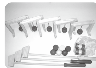
●ゲートボールセット