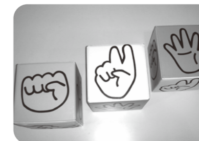
●ジャンケンサイコロ