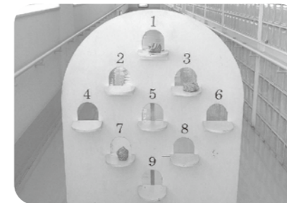
●スロービー(お手玉のせ)