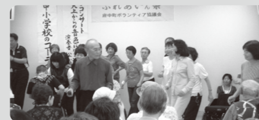
ステージ発表 車いすダンス