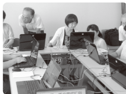
パソコンによる要約筆記!