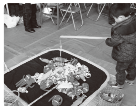
布おもちゃの魚釣りゲーム