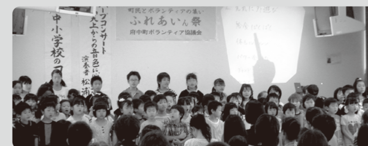
府中小学校「かがやけ 府小っ子隊」によるコーラス