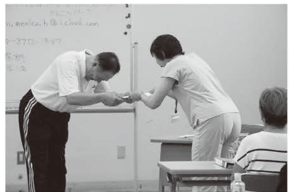
修了証授与の様子