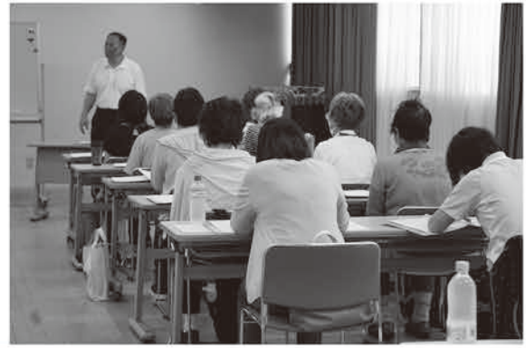
座学にて必要な知識を身につけます