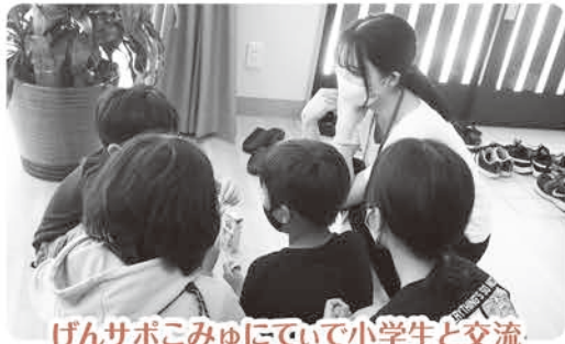
げんサポこみゆにて小学生と交流

府中町社会福祉協議会では、社会福祉士を目指す学生の、現場実習の受け入れを行っています。 8月から9月にかけて、広島文教大学から2名の実習生を受け入れました。