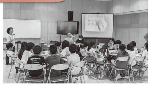
要約筆記サークル「うさぎ」