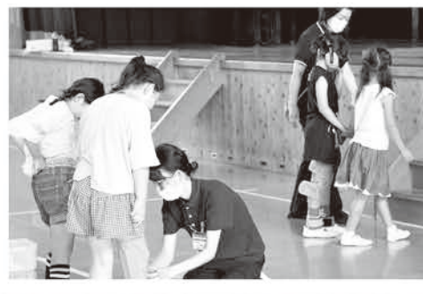
府中町特養相談員連絡会「FMC」