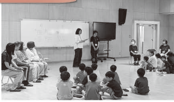
手話サークル「わかば」