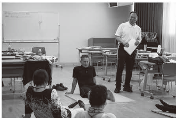
実際に身体を動かしながら習得します