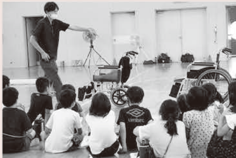
車椅子・高齢者疑似体験:府中町特養相談員連絡会「FMC」