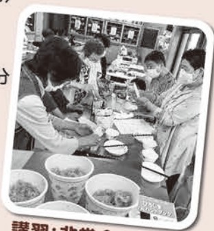
講習:非常食の試食

地球温暖化を背景に、気象災害が頻発しています。今こそ、災害への向き合い方を再考するときではありませんか。地域住民の一人として「自分の命は自分で守る!自分たちの地域は自分たちで守る!」ことを考え、災害について知って、学んで、備えて行動しましょう。各講習会を開いて学びを深めています。