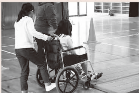
車椅子・高齢者疑似体験:府中町特養相談員連絡会「FMC」

実際に「点字」を打ってみたり、「車椅子・高齢者疑似体験」では、車椅子に安心して乗ってもらう為に、どのような声かけをしたらよいのかななどを考えながら学びを深めました。