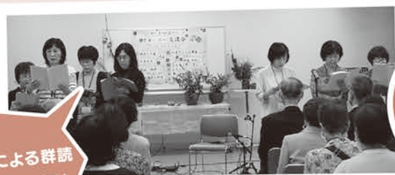
メンバーによる群読 「スーホの白い馬」