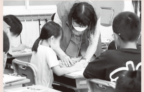
点訳体験:点訳サークル「ますあけ」