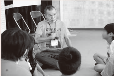
手話体験:手話サークル「わかば」