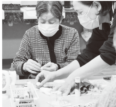
季節感のある作品づくり