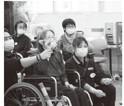
楽しいレクリエーション