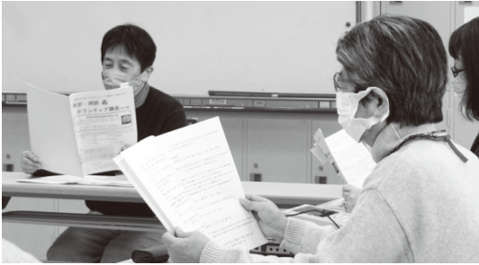
音訳朗読ボランティア講座

ボランティア協議会には28団体が所属しており、様々な活動を行っています。各種ボランティア養成講座や、イベントも開催しています。 (※グループ一覧はP6～7に掲載)