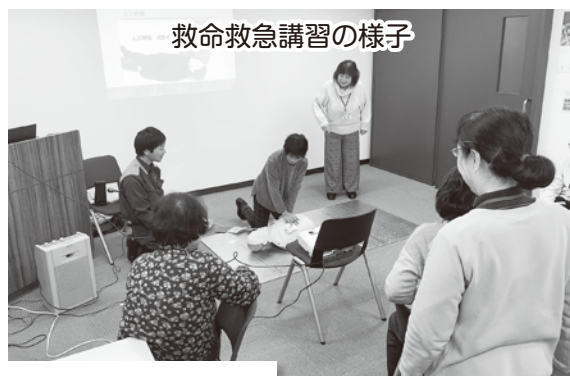
救命救急講習の様子