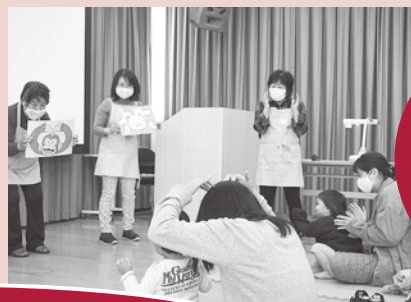
絵本の 読み聞かせ 「えほんの 玉手箱」