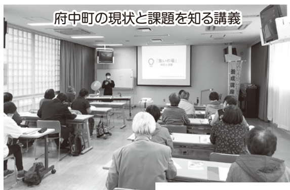
府中町の現状と課題を知る講義

をテーマとして、府中町内でリードしていただく方、 「府中町お元気サポーター」を養成する講座を毎年開催します。