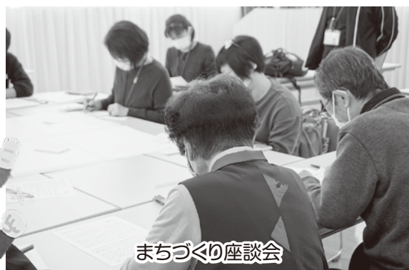
まちづくり座談会